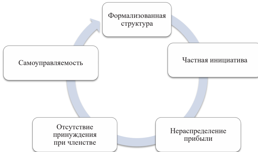
Рисунок 1 Критерии СО НКО в условиях взаимодействия с органами власти