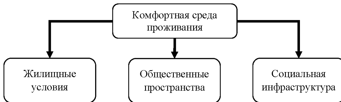
Рисунок 1 – Компоненты комфортной среды проживания

Комфортная среда проживания в сельской территории – это совокупность условий, созданных человеком и природой в границах населенного пункта, обеспечивающих удовлетворение социальных и иных потребностей и формирующих качество жизнедеятельности сельского населения. Комфортная среда проживания на селе включает в себя три компонента (рис. 1).